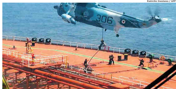
Em 27 de abril militares iranianos apreenderam outro petroleiro que ia aos EUA

"Nos unimos à comunidade internacional para pedir ao governo iraniano e à Marinha iranianas que libertem imediatamente o navio e sua