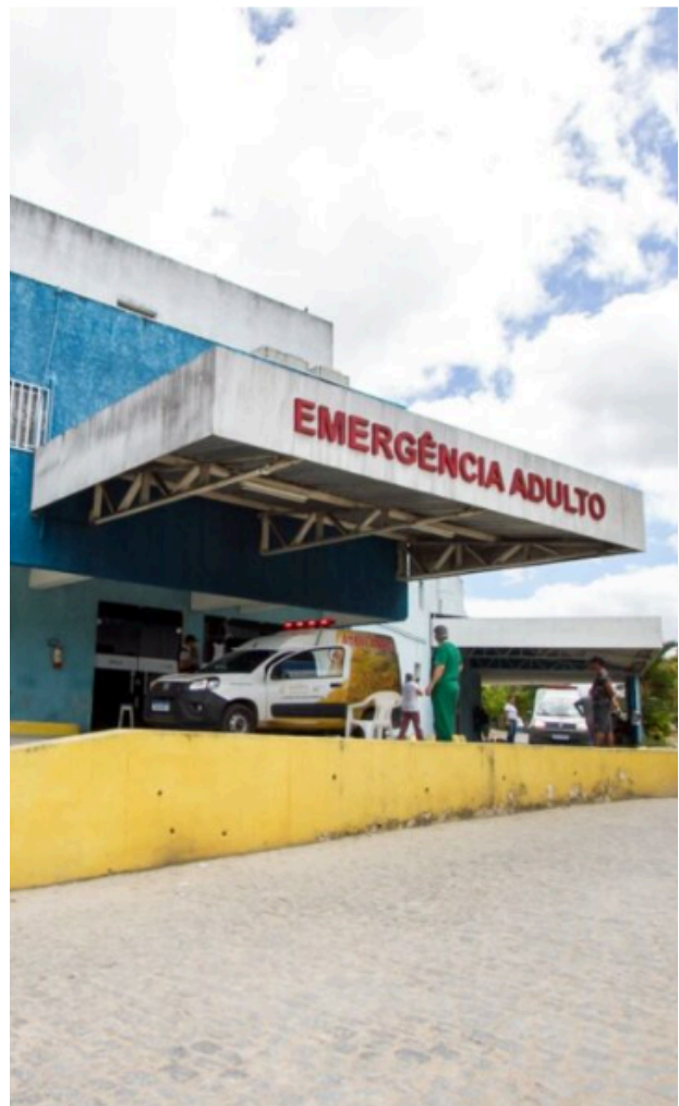
Hospital Regional do Agreste