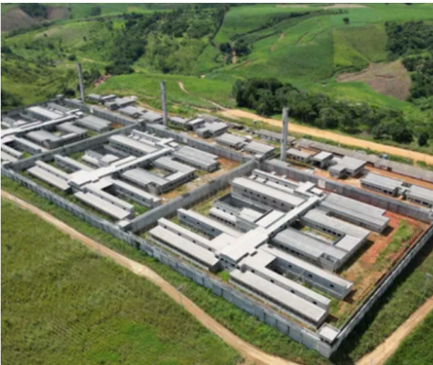
Unidades prisionais em Araçoiaba

No exercício de 2025, destacou-se a atuação da Companhia nos programas estruturantes do Governo do Estado, com foco na ampliação do acesso à moradia digna e na melhoria das condições de habitabilidade. As ações desenvolvidas contribuíram diretamente para a redução do déficit habitacional, a promoção da inclusão social e a garantia de segurança jurídica às famílias beneficiadas.