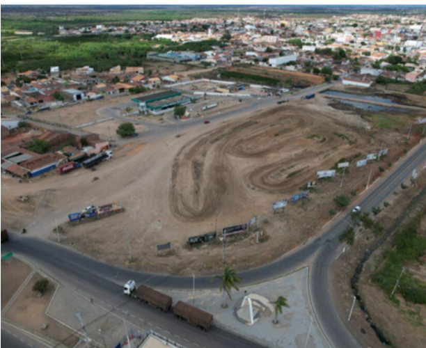
Trecho da rodovia PE-604