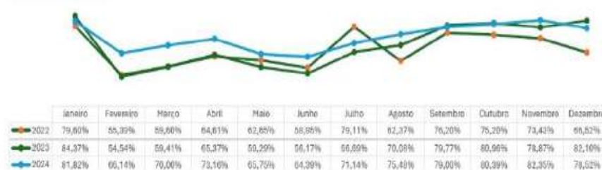
Taxa de Ocupação

A Empresa EJS HOTEIS E TURISMO S.A., inscrita no CNPJ(MF) sob nº 07.417.970/0001-36, com registro na JUCESE sob nº 283000042186, é uma sociedade é uma sociedade anônima fechada, com sede no Sítio Tingui, S/Nº - Município de Barra dos Coqueiros – Sergipe, iniciou sua operação em 25 de maio de 2005, sua atividade principal é hotelaria, atualmente explora a modalidade Resort ALL Inclusive. No ano de 2024 a média de ocupação foi em torno de 74,01%, mais de 151 mil hóspedes ocuparam suas unidades, estando o empreendimento um dos principais pontos de atração turística do Estado de Sergipe e entre os maiores em faturamento.