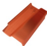
LINHA TOP MATIZADA