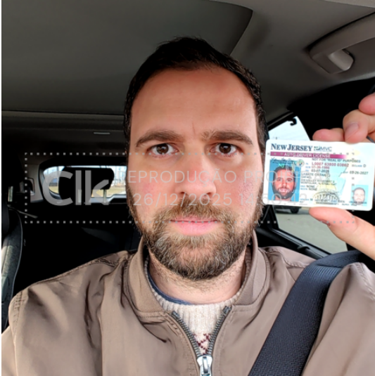
selfie_26 dez 2025, 14-50-42.png

Foto da face com documento com hash SHA256 prefixo c7b676(...)