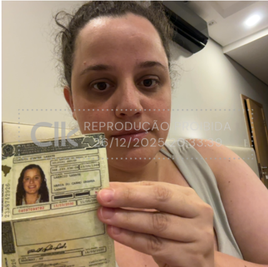
selfie_26 dez 2025, 20-33-40.png

Foto da face com documento com hash SHA256 prefixo 0f8779(...)