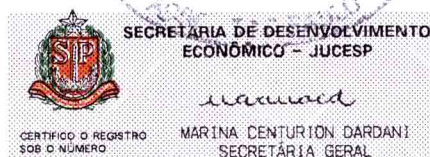
RODRIGO NELSON BRUM SELLES