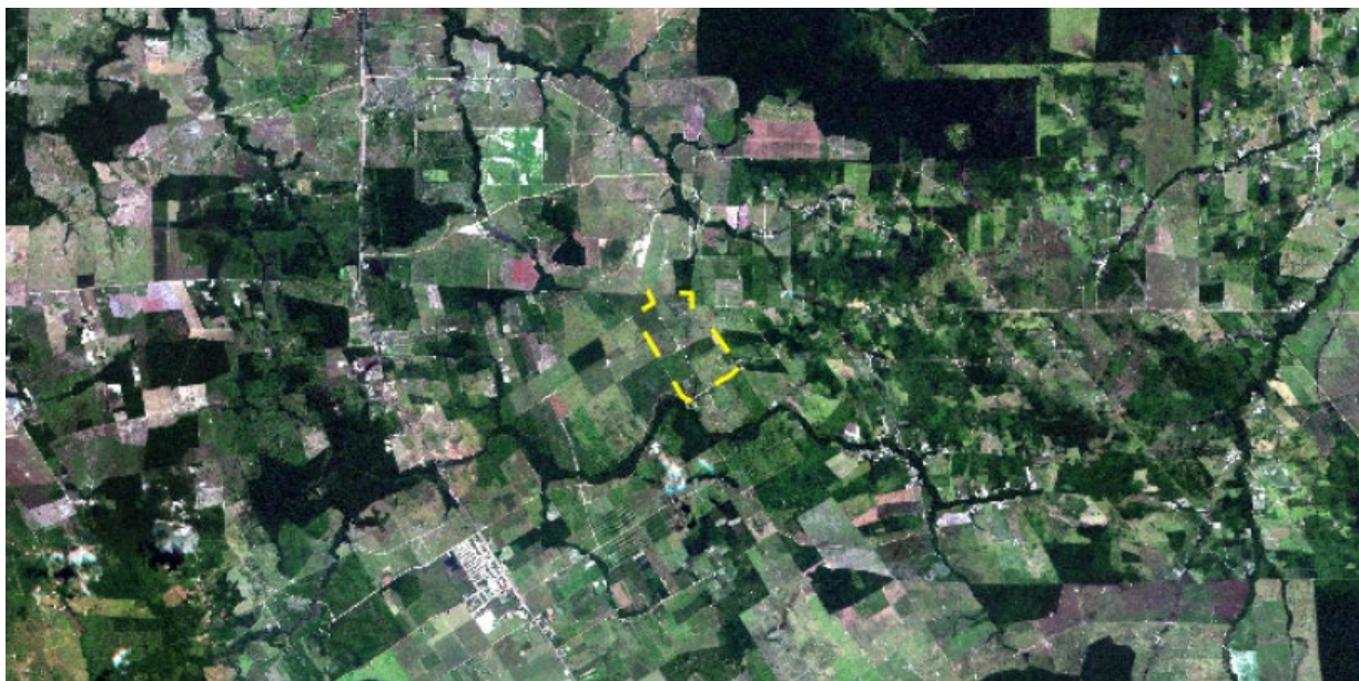
Imagem 01: Imagem de satélite da propriedade Morada Nova.