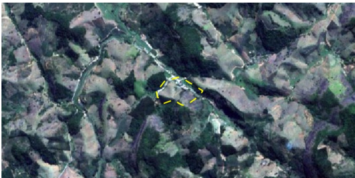
Imagem 02: Imagem de satélite da propriedade Angá. FONTE: SICAR.