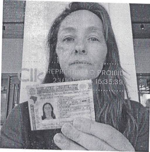
selfie_23 out 2025, 15-35-40.png

Foto da face com documento com hash SHA256 prefixo 440ef5(...)