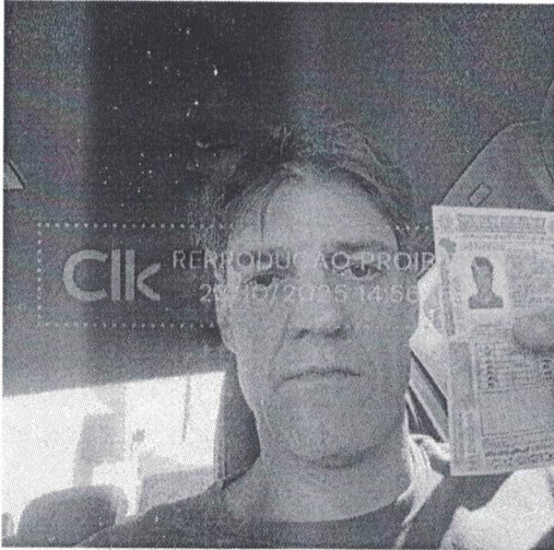
selfie_23 out 2025, 14-56-16.png

Foto da face com documento com hash SHA256 prefixo 066800(...)