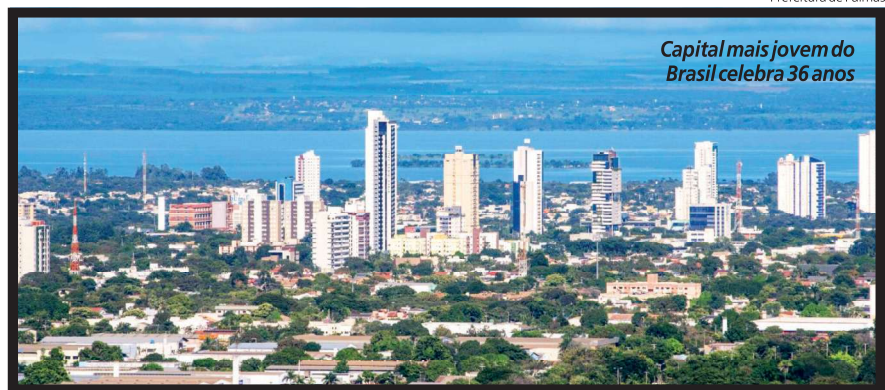
Capital mais jovem do Brasil celebra 36 anos