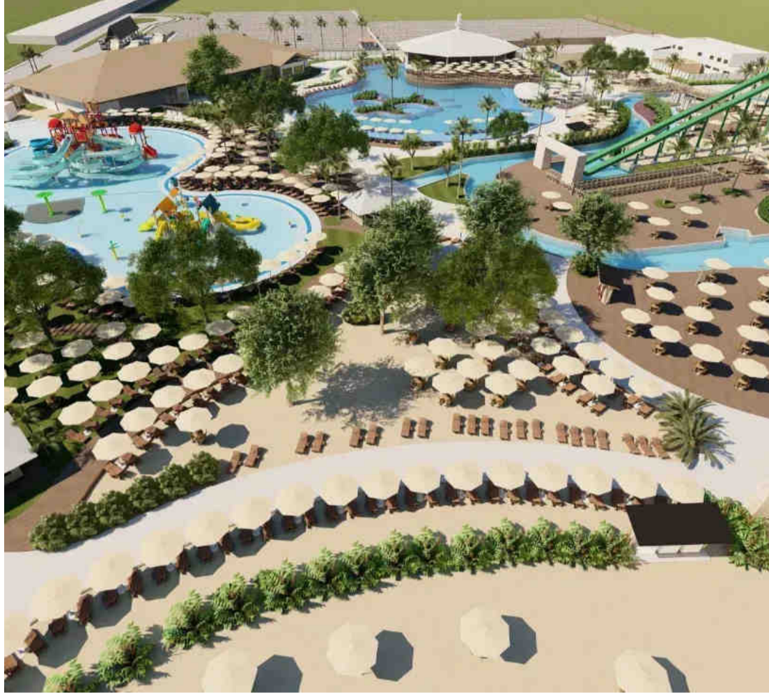
Usuários de um mega parque aquático inaugurado no dia 25 de abril na Praia dos Carneiros relatam acidentes e desespero