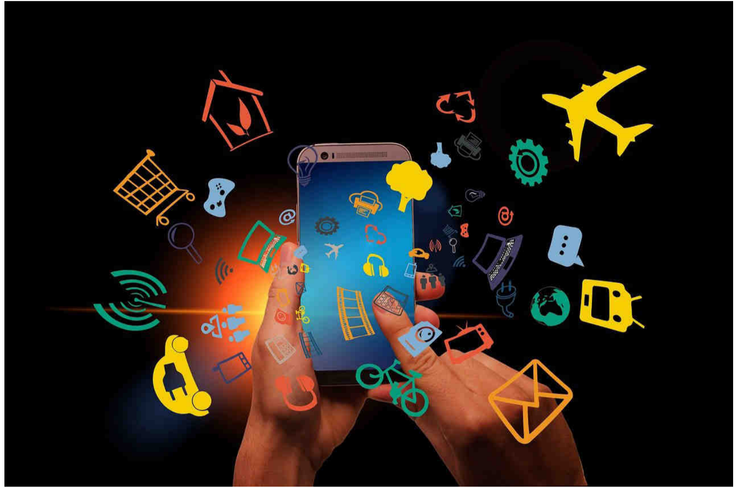
Os resultados mostraram que quase todos os analfabetos, 95%, estão no nível baixo, ou seja, conseguem realizar apenas um número limitado de tarefas no contexto digital.

Segundo a pesquisa, considerando a idade, os mais jovens são aqueles que se situam no nível mais alto de desempenho digital, com