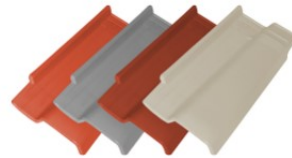
LINHA TOP COLOR