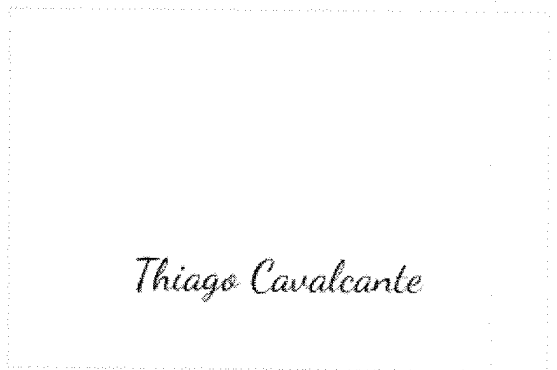
Assinatura de Thiago Cavalcante

ZapSign Token: a29f0ed5-****-****-****-a4d6db6c2ed8