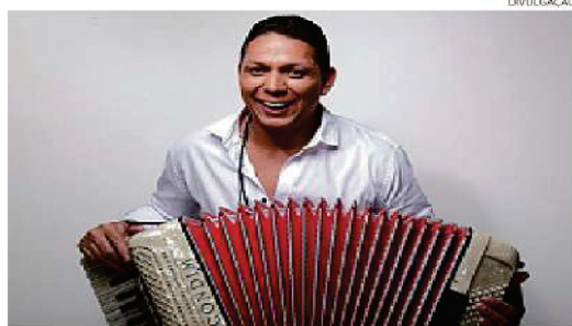
Targino Gondim será uma das atrações do Forró no Parque

Targino Gondim está prestes a iniciar uma nova turnê intitulada Por Esse País, que vai percorrer diversas regiões do Brasil, levando o autêntico som do forró para plateias de norte a sul. Já estão confirmados shows no Rio de Janeiro, São Paulo, Sergipe e Pernambuco.