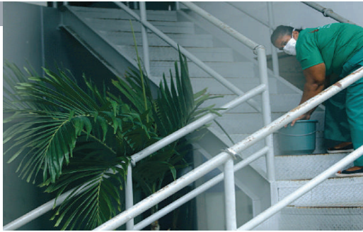
Base de apoio no Rio Vermelho é limpa para receber pacientes

transferências, independentemente da unidade, pois o processo de regulação envolve uma série de fatores, como disponibilidade de vaga, perfil do paciente, tipo de recurso (ambulância básica ou UTI), dentre outros”, explicou a Sesab, em nota.