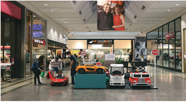
Reabertura de centro comercial atraiu muita gente em Blumenau