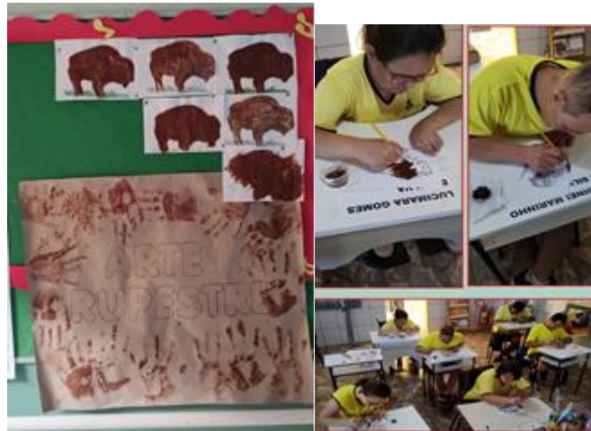
Atividade de Arte, usuários aprendendo sobre Arte Rupestre utilizando pigmentação de recursos naturais.