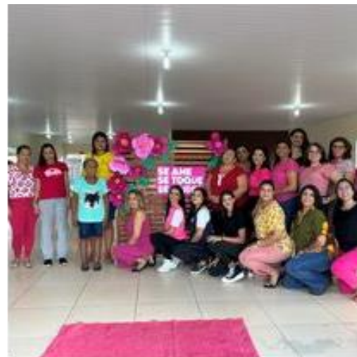
Ação Outubro Rosa, conscientização sobre o câncer de mama, com a participação dos usuários e famílias.