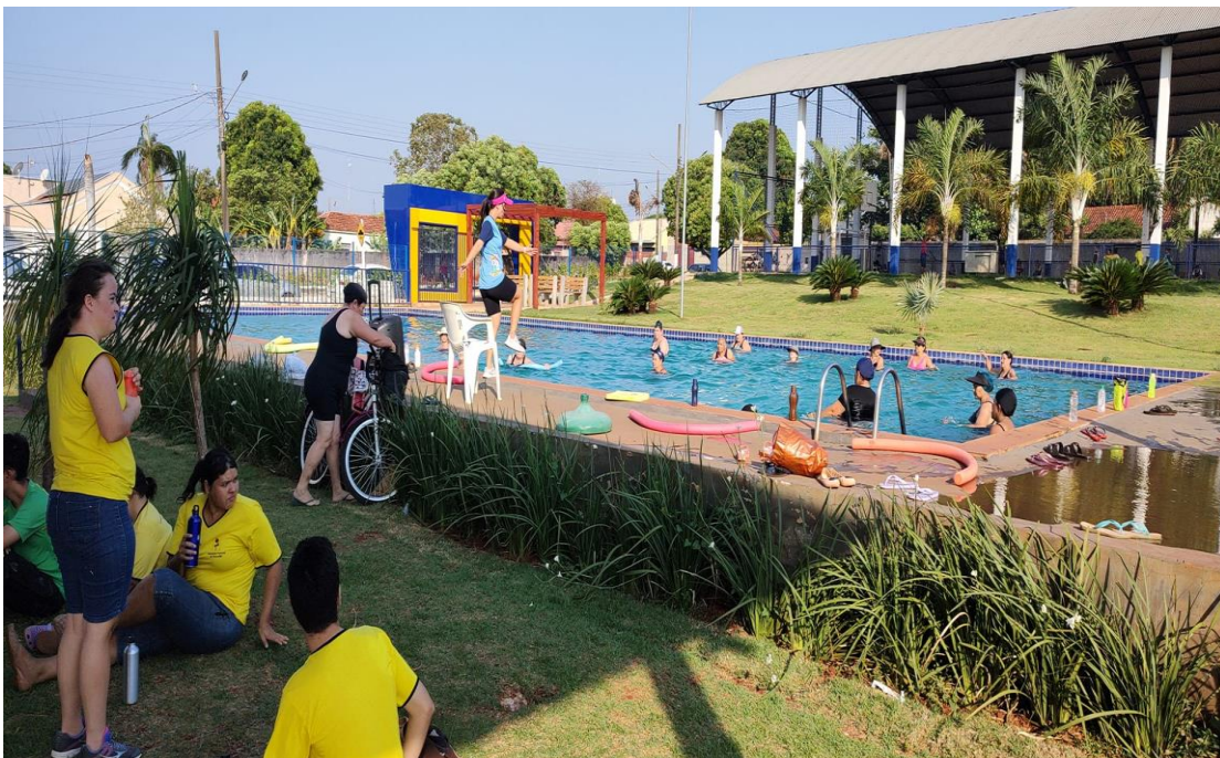
PROJETO INTERAGIR: "Arte-Cultura, Esporte-Lazer"

TERMO DE FOMENTO CELEBRADO ENTRE A SECRETARIA DE ESTADO DE DIREITOS HUMANOS, ASSISTÊNCIA SOCIAL E TRABALHO/SEDHAST/MS E A ASSOCIAÇÃO PESTALOZZI DE TRENOS