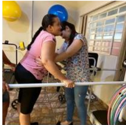
Atividades de fisioterapia com os usuários