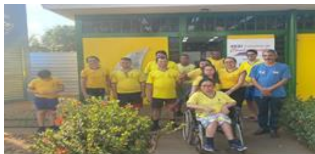
Passeio com os usuários em comemoração ao dia do Estudante.