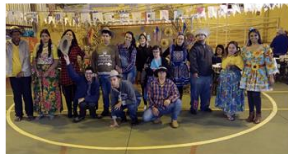
Atividades dos usuários da Pestalozzi no Projeto Compartilhar é a Conexão, diretoria e comunidade na Festa Julina