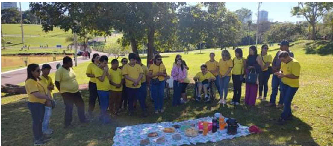
Passeio no Parque das Nações Indígenas em Campo Grande – MS, com usuários e familiares em comemoração aos 37 anos da Associação Pestalozzi de TRENOS.