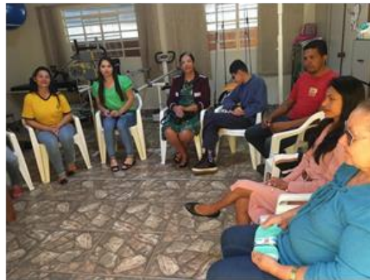
Conexão entre profissionais (fisioterapeuta, psicóloga e Assistente social) e família dos usuários.