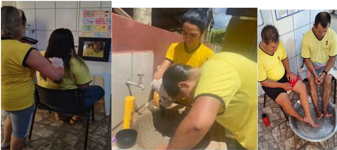
Atividades com os usuários da Pestalozzi no Projeto Compartilhar é a Conexão com a atividade "Dia da Beleza".