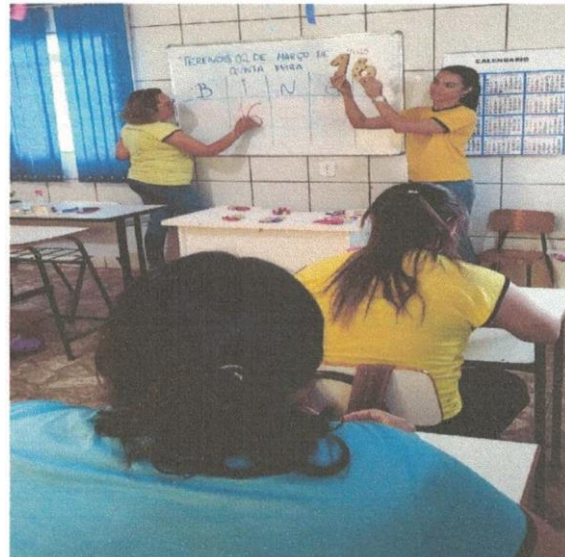
Atividade de bingo realizada com os usuários, focando na memorização, associação de letras e números.