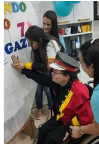
Atividades dos usuários da Pestalozzi no Projeto Compartilhar é a Conexão e Projeto da Banda Fanfarra Sou Futuro Sou Valorizado Campanha pintando o 7 Gazin.