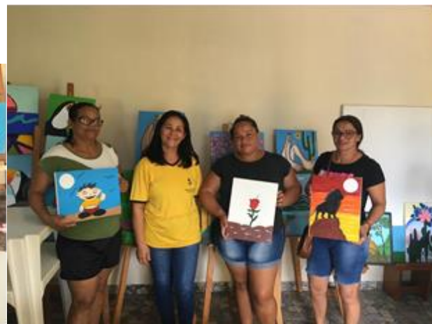
Oficina de pintura realizada com apoio da Assistente Social junto às mães dos usuários.