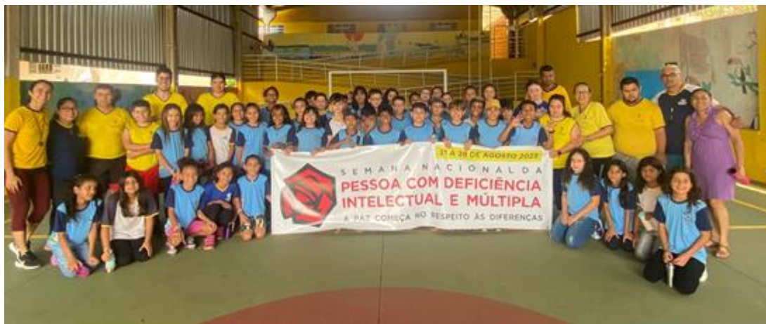
Semana Nacional da Pessoa com Deficiência.