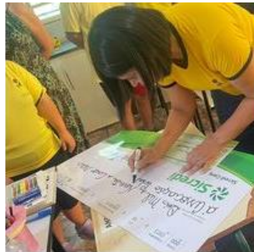
Recebimento da doação da Festa do Ovo