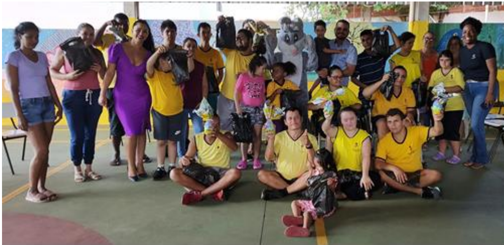
Atividade de Páscoa com os usuários e famílias do Projeto Compartilhar é a Conexão: acolhida do Coelho da Páscoa e doação de ovos de Páscoa da Cacau Show.