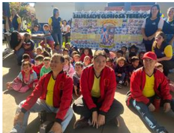
Participação dos usuários no Projeto Salve, Salve Gloriosa Terenos. Aprendendo um pouco mais sobre o nosso município.