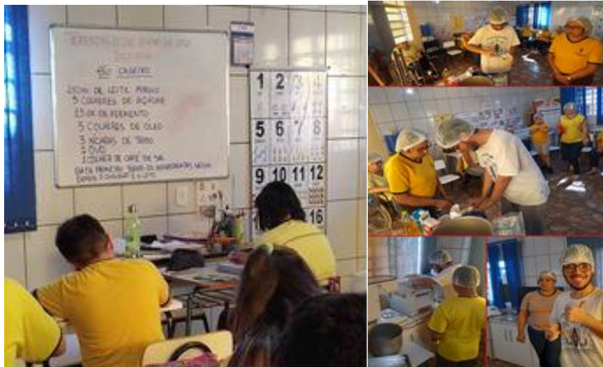
Aconteceu oficina de culinária para o Mercado do Trabalho onde as instrutoras e professoras trabalharam conteúdos de forma multidisciplinar.