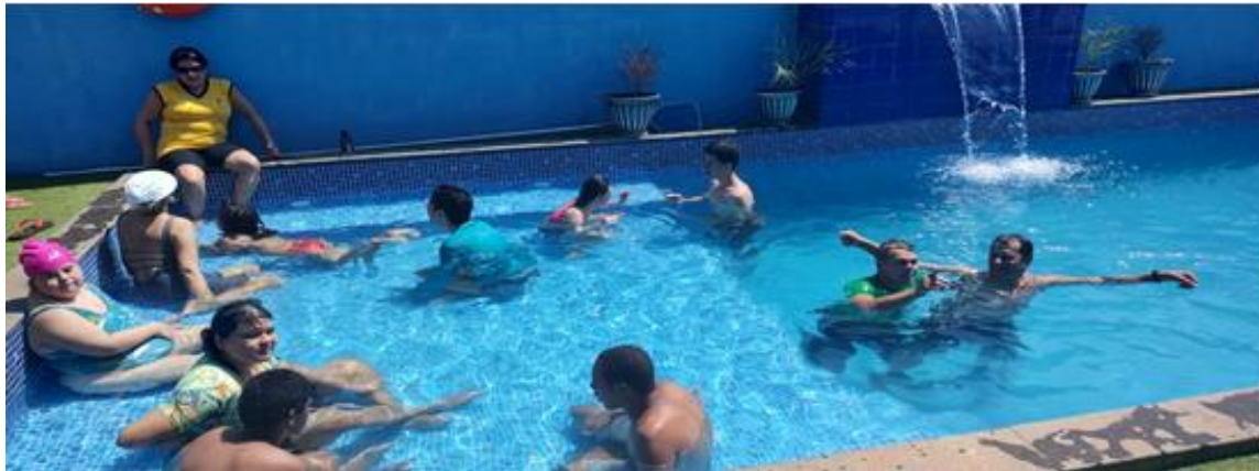
Dia de Lazer com usuários e família no Recanto Teófila Ramirez