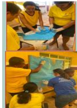
Atividade sobre o dia dos pais com usuários.