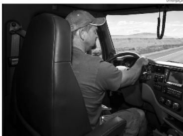
Exame é obrigatório para condutores de veículos das categorias C, D e E

Outra forma de acesso às informações é o aplicativo da carteira digital de trânsito. Na área do condutor, o motorista também pode verificar se o exame toxicológico está em dia. No caso de o prazo ter vencido, o condutor deve buscar um dos laboratórios credenciados a fazer a coleta