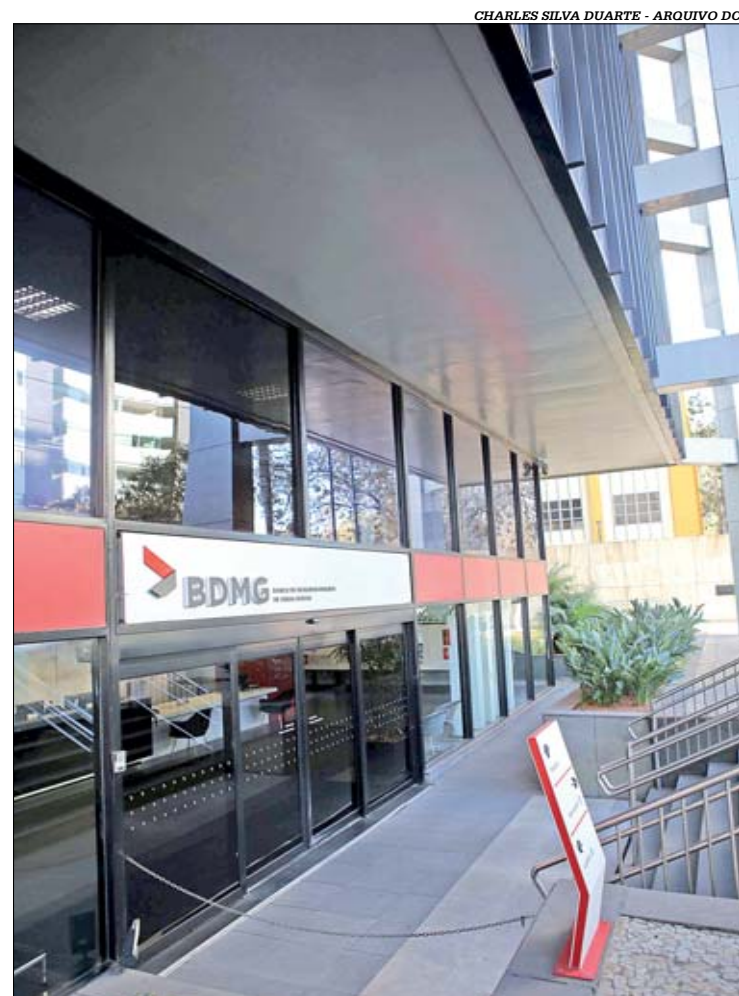
BDMG ainda vai avaliar se flexibilizará valor estipulado no edital

prefeituras precisam articular a aprovação do financiamento com a Câmara Municipal. Depois, é necessário atualizar seus