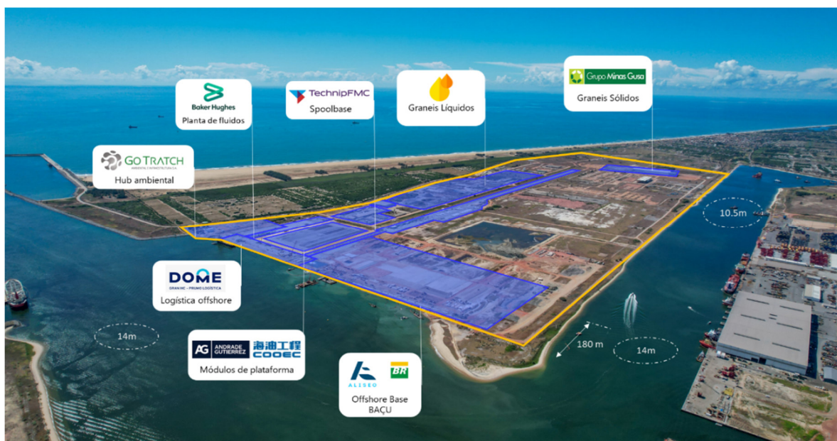
Figura 1 - Vista aérea da área OSX Açú, com destaque para os clientes

O complexo do Super Porto do Açú vem passando por forte crescimento, com a área da OSX Açú se destacando como o principal local para implantação de novos negócios, em função de sua localização estratégica e do comprimento de área molhada em frente ao canal do porto.