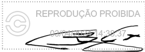
Thomaz Brandão Teixeira 03 abr 2024, 14-38-38.png

Assinatura manuscrita com hash SHA256 prefixo 63f8c9(...)